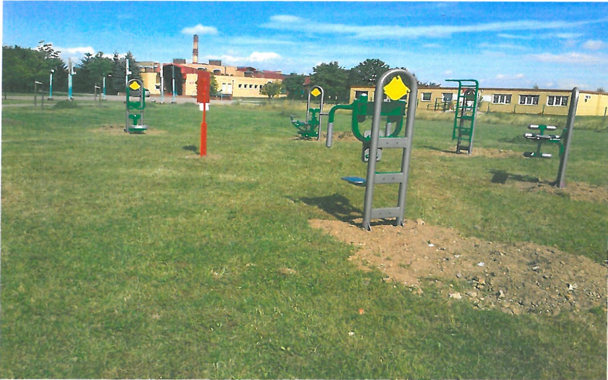
Nowo otwarta siłownia zewnętrzna na Osiedlu Zawiszów