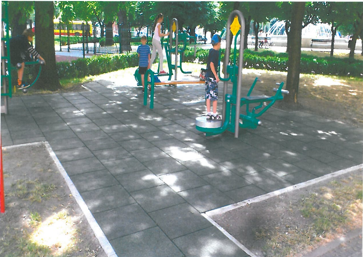
Nowo otwarta siłownia zewnętrzna przy placu św. Małgorzaty