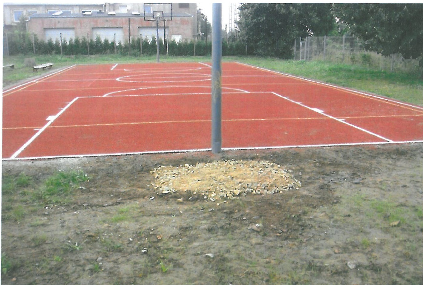
Nowo oddane boisko do koszykówki przy Niepublicznej Katolickiej Szkole Podstawowej Caritas Diecezji Świdnickiej