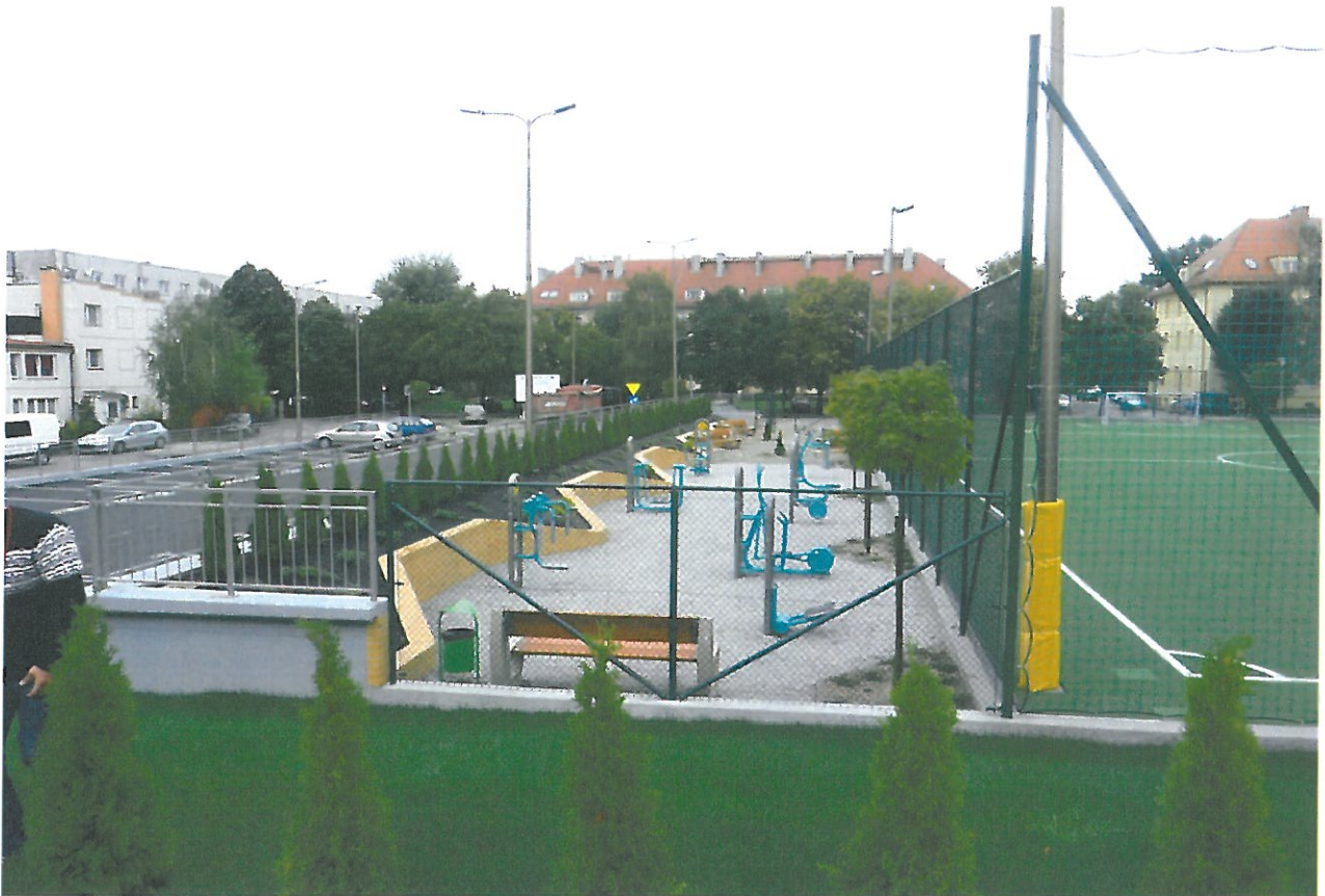
Nowo otwarte Centrum Rozrywki przy ul. Ułańskiej